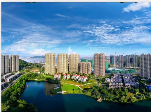
3、碧桂园南沙天玺湾项目